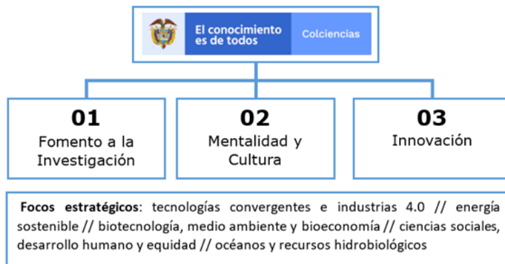
Imagen 2. Focos estratégicos de Colciencias

El Departamento Administrativo de Ciencia, Tecnología e Innovación (Colciencias) 2 es la entidad encargada de promover las políticas públicas para fomentar la ciencia, la tecnología y la innovación en Colombia. Es el principal organismo de la administración pública colombiana encargado de formular, orientar, dirigir, coordinar, ejecutar e implementar la política del Estado en los ámbitos mencionados.