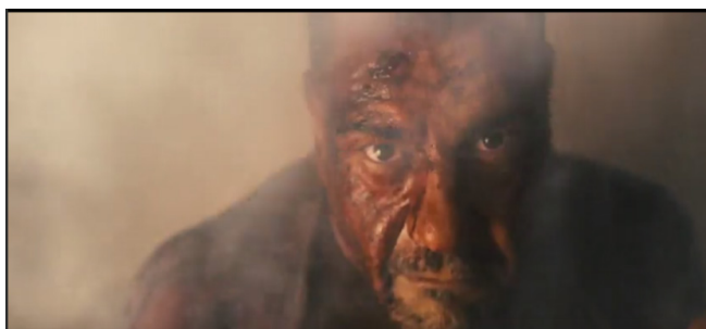
Figura 9. Los últimos momentos. (Minuto 35:54).

La figura 8, primer fotograma, es un plano general (ocularización cero) en la que se muestra cómo debido al incidente del neumático, Diego termina cayendo sobre el auto de Mario. En el segundo fotograma se hace uso de un contra plano (ocularización interna secundaria) en el cual, dentro de los vehículos destrozados, los personajes continúan irreversiblemente el enfrentamiento. Se ve cómo Diego, en un plano detalle, toma un extintor como arma para defenderse de Mario. Luego lo golpea con este y se libera su contenido (en la figura 9 se aprecia a Mario envuelto por el gas del extintor). En el desarrollo de la figura 8, primer fotograma, hay una auricularización interna secundaria, en la que los sonidos son la respuesta a lo visto; es decir, a los golpes que ellos se dan. En el siguiente fotograma, hay una auricularización interna primaria, pues en la lucha encienden la radio y suena una música que no se relaciona directamente con lo que sucede, sino que es más bien opuesta a lo que se ve.