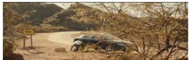
Figura 6. Preludio de una desgracia. (Minuto 25:44 - 26:15)

Lo que sucede en los fotogramas de las figuras 4 y 5 demuestra cómo en el cine hay múltiples recursos, distintos de lo literarios, para dar sentido a la historia narrada en imágenes, para capturar la atención del espectador a través de los modos en que imagen y sonidos son tratados por el creador cinematográfico.