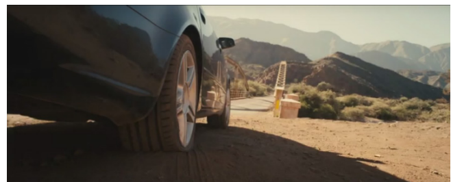
Figura 3. El neumático pinchado. (Minuto 23:20).

En la escena de la figura 2 se hace uso de un plano conjunto que nos remite a una ocularización cero, en él se ven los autos como representación del nivel socio-económico de los personajes y un insulto realizado por Diego luego de haber pasado a Mario. Es un punto de vista de la cámara, no es alguien que esté viendo esto al interior de la película. También se hace evidente la auricularización cero , ya que, mientras Diego se aleja de Mario la música inicial retoma la ambientación del filme; es decir, la música remite no a sonidos al interior de la ficción, de los hechos, sino, es una música que viene de afuera.