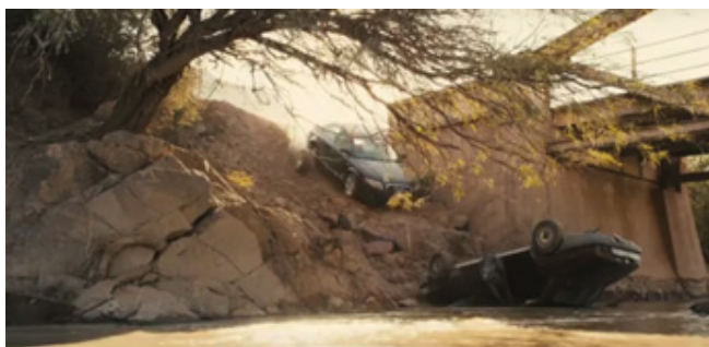
Figura 8. La batalla final. (Minuto 33:38 - 34:54).