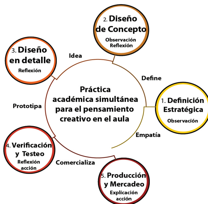
Figura 2: Fases para el desarrollo o mejora del producto o servicio con el acompañamiento de una práctica académica simultánea para el pensamiento creativo en el aula. Tomado de http://msdproductos.diniko.com/ Fuente adaptación Propia

El vincular una práctica pedagógica en el aula, bajo un enfoque epistemológico interpretativo y que, toma la ingeniería concurrente como método de direccionamiento del razonamiento lógico para obtener y tomar decisiones