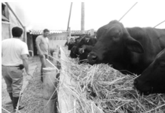
Fotografía 8. Canoa de alimentación en "V" sistema de producción 4.