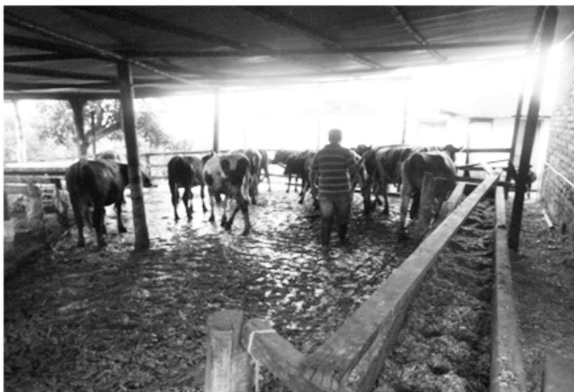
Fotografía 4. Sistema de producción 2 (Brasilia, Salento).