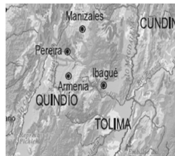
Fotografía 2. Mapa de uso del suelo en Colombia, ubicación del departamento del Quindío.