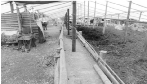
Fotografía 3. Sistema de producción 1 (Gacela, Circasia).