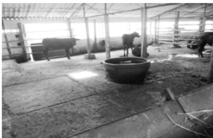
Fotografía 6. Sistema de producción 4 (Esperanza, Montenegro).

El referente de producción de la región se ha enfocado en la producción de carne con altas cargas animales, es decir, un modelo intensivo. Los profesionales pecuarios de la región y los productores identifican cargas de 8 hasta 10 animales por hectárea, el incremento de estas, trae por consecuencia la compactación del suelo, esta a su vez, genera una disminución en la entrada de aire y agua lo que reduce la diversidad biológica, existe evidencia que la densidad aparente de un suelo que antes se dedicaba al cultivo de café se encontraba en el orden de 0.8 g/cc y que