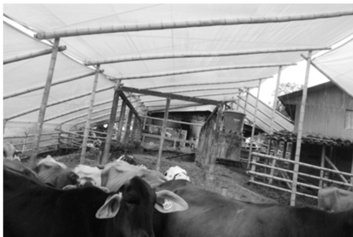
Fotografía 5. Sistema de producción 3 (Ponderosa, Circasia).