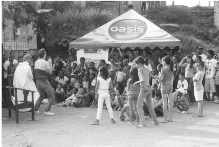
Fotografía 6: Grupo de teatro de la UGCA en una actividad lúdico – investigativa.

Con la intención de identificar las actuales condiciones sociales, políticas, ambientales, culturales, económicas y de habitabilidad presentes en la comunidad del asentamiento informal Milagro de Dios, se elabora un diagnóstico situacional del desarrollo y de las condiciones de vida en dicha comunidad de manera participativa; utilizando técnicas cuantitativas y cualitativas dentro de las que se cuentan las encuestas, entrevistas semiestructuradas, observación participante, talleres, visitas e historias de vida con la participación de los estudiantes y docentes acompañadas de actividades lúdicas que facilitan la construcción de confianza entre la comunidad y la universidad.