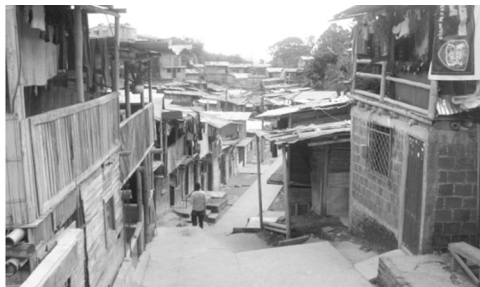
Fotografía 3: Calle central del asentamiento.

El 38% de su población está por debajo de los 17 años, de los cuales el 8% no se encuentra escolarizado. Los hogares en el asentamiento en su mayoría están conformados de manera nuclear (36%) y extensa (34%). Sus ingresos se derivan principalmente de actividades informales y