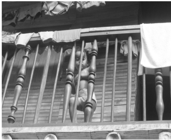
Fotografía 9: Niña del Milagro de Dios.

Durante el trayecto proyectual se ha logrado concluir que la falta de toma de conciencia por parte de las comunidades vulnerables acerca de sus posibilidades, recursos, limitaciones y necesidades restringe su participación en el desarrollo de la ciudad, así mismo, que la ausencia de una política pública para asentamientos humanos informales en la ciudad que responda a las necesidades de las comunidades favorece la permanencia de estas en un estado de indefinición a lo que se puede dar respuesta a través de un trabajo mancomunado de los diferentes estamentos de la sociedad hacia un mismo objetivo, en la vía para alcanzar un: “Nosotros Territorial”.