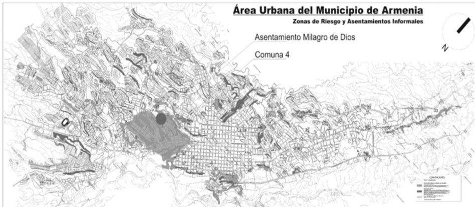
Ilustración 1: Localización Comuna 4 y Asentamiento Milagro de Dios.