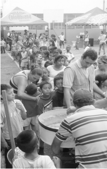
Fotografía 5: Actividad navideña.